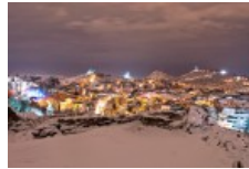
Ταξίδι στη Φιλιππούπολη με αυτοκίνητο! 29.12.2014 | 10:38