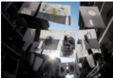
Οι φοιτητές της Καλών Τεχνών έκαναν κάτι ωραίο, στο κέντρο της Θεσσαλονίκης 21.12.2014 | 11:00