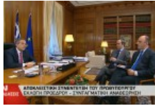
Προσβλητική για τη δημοσιογραφική δεοντολογία η συνέντευξη Σαμαρά 28.12.2014 | 13:21