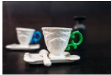
Εδώ λατρεύουν το καλό design! 29.12.2014 | 16:27