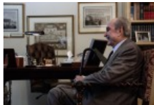
Η μακρινή δύση του Κωνσταντίνου Μητσότακη 18.12.2014 | 12:35