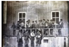
16 σπάνιες φωτογραφίες που δείχνουν τον ρατσισμό και τον ναζισμό στην ανθρώπινη ιστορία 19.12.2014 | 09:00