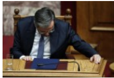
Ολομέλεια για κλάματα και αυτοί που αποφάσισαν την πρόωγη προσφυγή στις κάλπες 29.12.2014 | 16:22