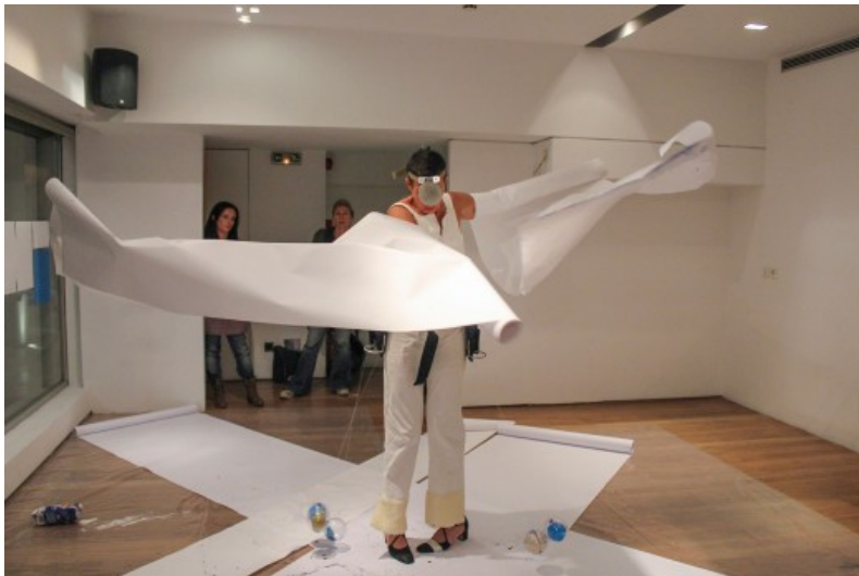
Με την υπόθεση ότι όλοι ξεκινάμε «άδειοι» και ίσοι, καθώς οι μετέπειτα εμπειρίες μας διαμορφώνουν το περιεχόμενό μας, η καλλιτέχνις εντάσσει τον ήχο μέσα από το ρολό χαρτιού ως σύνδεση με τα εξωτερικά ακούσματα κατά την εμβρυακή περίοδο...