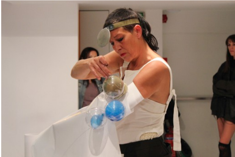
Και στα δύο έργα η καλλιτέχνις ασχολείται με το χαρτί –το λευκό χαρτί– που θεωρεί άδειο καμβά, το ξεκίνημα της ζωής...

Οι καλλιτέχνες, προερχόμενοι ο καθένας από τον δικό του τομέα πρακτικής, όπως η αρχιτεκτονική και φωτογραφία, κλήθηκαν να παραθέσουν την προσωπική τους εκδοχή για το ανδρικό σώμα το οποίο φέρει επάνω του την «ιστορία» του ως κοινωνικό κατασκεύασμα, με βάση τις προϋποθέσεις και τις απαιτήσεις που θα πρέπει να πληροί. Ο τρόπος αντιμετώπισης αυτής της οντότητας, από τον ένα άνδρα στον άλλο, αποτελεί εν τέλει μια αντανάκλαση των τρόπων αντίληψης του κάθε καλλιτέχνη για τον δικό του «ανδρισμό». Θέτοντας ως ερώτημα την αξία της «συνεργασίας», η έκθεση θέτει την καλλιτεχνική δράση ως μια κοινή και συμμετοχική διαδικασία που κατευθύνεται από τον δημιουργό προς το κοινό.