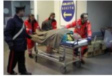
"Η φωτιά εκδηλώθηκε ταυτόχρονα σε τρία σημεία" 28.12.2014 | 17:47