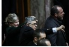
Υβρεις, φτύσιμο και ένταση από την Χρυσή Αυγή στο Κοινοβούλιο 29.12.2014 | 13:41