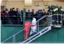
Ακόμη 4 νεκροί στο Norman Atlantic σύμφωνα με μαρτυρία επιβάτη στην RAI 29.12.2014 | 11:10